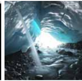
Inside the Glacier