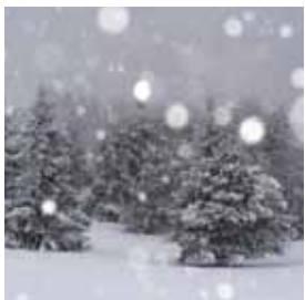
Silenzi Corrado Zagni