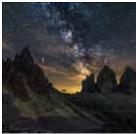
La via del cielo Luca Bentoglio