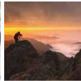
Professione Fotografo Michele Rossetti