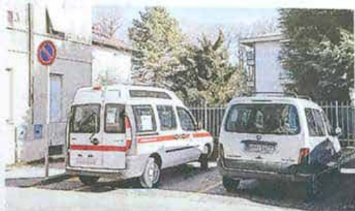
Spazi di sosta per i disabili a Treviglio

Il gruppo «Treviglio urbana» è entrato in azione a fianco del comitato disabili «Come noi»