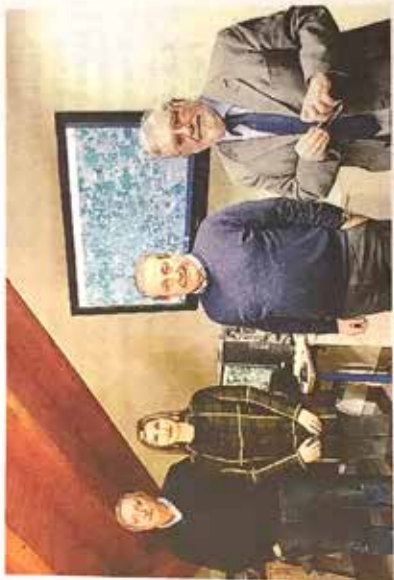
La presentazione della mappa degli spazi per disabili a Treviglio (ESN)

Un modo per aiutare le persone con disabilità a trovare gli riservati, sfruttando anche le indicazioni video e audio. Un'iniziativa che ha coinvolto anche i volontari del comitato «Come noi» e poi ottenuto il benestare dell'Amministrazione comunale, che ha accolto la proposta della mappatura e quella dell'approdo online. D'ora in avanti sarà sufficiente cliccare sul link https://goo.gl/maps/dqJ3Y7FaRr , per ottenere su smartphone, tablet e pc, la schermata che appunto mostra