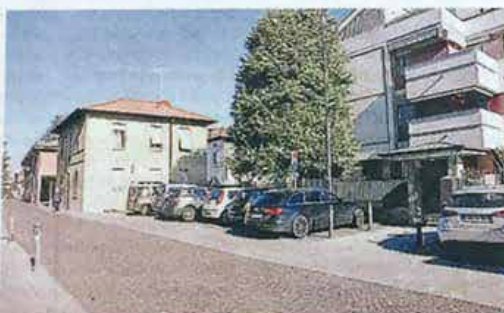
È pronta la mappatura di tutti gli stalli presenti in città

tra cittadini e Comune, tratta in una pubblicazione dalla quale risulta che i posti auto riservati ai disabili sono 376, distribuiti in sei zone cittadine: centro storico, nord, sud, ovest, comparto residenziale «Bollone», circonvallazioni interna ed esterna. Dal puntiglioso rilievo, eseguito da una decina di volontari, grazie anche alla collaborazione di un agente della polizia locale, ora in pensione, e dell'associazione dei carabinieri in congedo, è emerso che 39 stalli sono privi di cartelli segnaletici, di questi 16 anche con perimetro assente o sbadito sul fondo stradale: quest'ultima criticità è stata inoltre ravvisata in altri 34 posti auto.