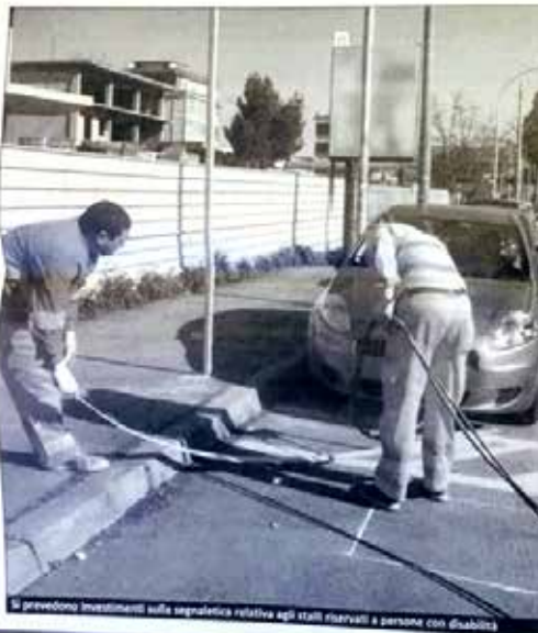
Si prevedono investimenti sulla segnaletica relativa agli stalli riservati a persone con disabilità

Il Comitato ha segnalato il problema degli stalli abusivi degli stalli per disabili e Treviglio Urbana grazie a una costru-