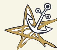
La Compagnia Dei Sogni