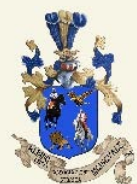
Associazione Storica Città di Albino