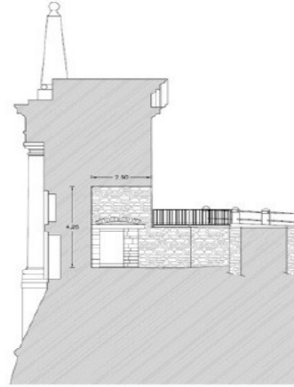
SEZIONE A-A DI PROGETTO